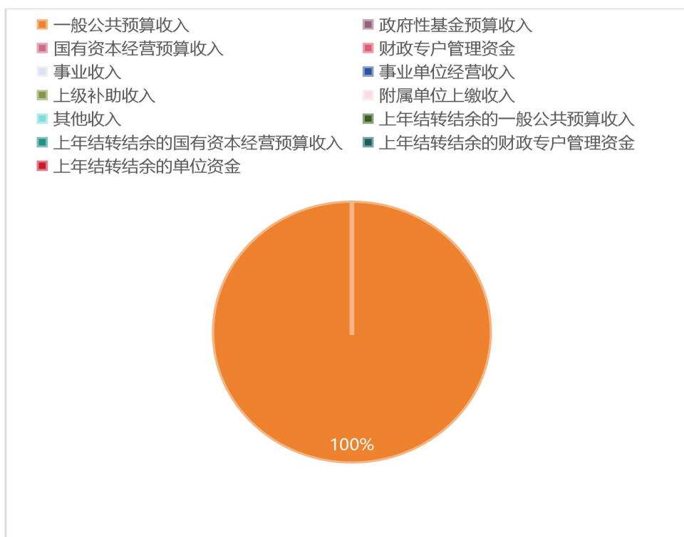
图 1. 收入预算图

上年结转结余的一般公共预算收入 0 万元，占 0% ； 上年结转结余的政府性基金预算收入 0 万元，占 0% ； 上年结转结余的国有资本经营预算收入 0 万元，占 0% ； 上年结转结余的财政专户管理资金 0 万元，占 0% ； 上年结转结余的单位资金 0 万元，占 0% 。