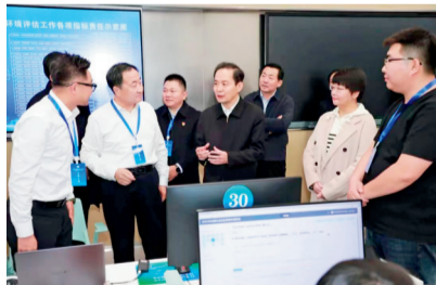
市委副书记 市长杜汇良现场督导检查营商环境评估填报工作

11月20日至24日，内蒙古自治区营商环境评估启动线上填报工作，鄂尔多斯市对应指标填报人员有序开始填报各类指标相关信息和佐证资料，开启“答卷”模式，力争营商环境评能够卫冕夺冠。鄂尔多斯市委副书记、市长杜汇良，市委常委、副市长苏翠芳，市中级人民法院院长苏利军到现场督导检查了填报工作。