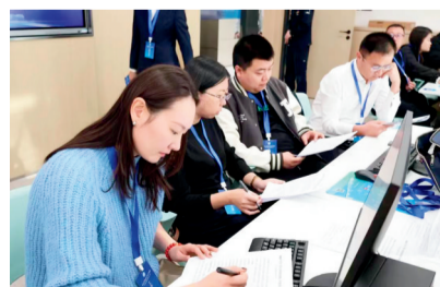
市级营商环境评估填报现场