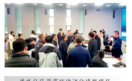
康巴什区营商环境评估填报现场

二是深学细悟把握重点。深刻理解和准确把握指标填报要求，分析研究各指标之间的关系，做到材料观点阐述有理有据、文字表述精炼准确、典型案例亮点突出、满意度调查真实高效。