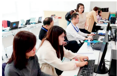
市级营商环境评估填报现场

根据内蒙古自治区人民政府办公厅印发的《内蒙古自治区营商环境评估实施办法》规定和2023年营商环境评估系统操作手册说明，本次区评的评估对象为全区12个盟市及其所辖旗县(市、区)，测评指标各盟市和旗县(市、区)各有不同标准，分部门数据线上填报和企业群众满意度调查数据调取两种方式开展，得分占比分别为70%和30%，这为全区优化营商环境各项工作指明了努力方向，是做好今年工作的“指挥棒”。区评时间明确以来，鄂尔多斯市优化营商环境工作专班组织各旗区、各部门、各单位有序迎接“年度大考”，全力以赴争创一流。