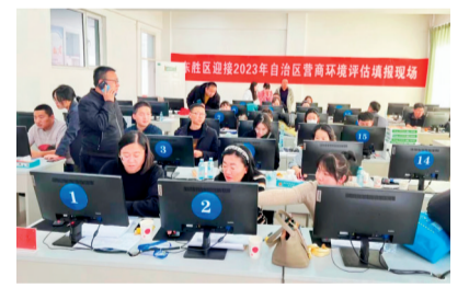
东胜区营商环境评估填报现场

政治站位，转变思想理念，切实把营商环境测评工作作为以评促改、以评促建、以评促优的重要抓手抓实抓好。