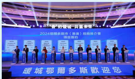
▲香港知名研究院、世界500强企业、中国500强企业、上市公司及各领域领军企业、部分商协会等120余人参加推介会。共签署项目8个，协议总金额126.5亿元，涉及能源、国际贸易、证券投资、低碳经济以及城市开发运营等多个领域。