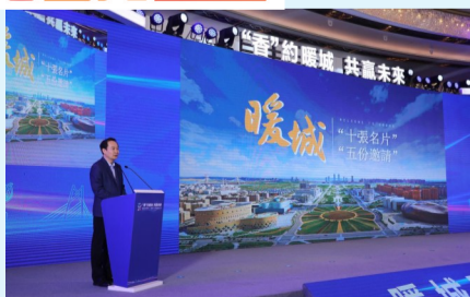
▲1月4日至5日，鄂尔多斯市分别在香港和澳门以“‘香’约暖城 共赢未来”和“相约暖城 赢以为‘澳’”为主题举办“链”上暖城鄂尔多斯—2024鄂尔多斯招商恳谈会。