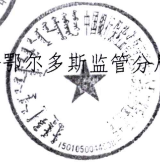
中国银行保险监督管理委员会鄂尔多斯监管分局