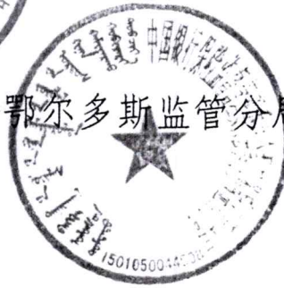
中国银行保险监督管理委员会鄂尔多斯监管分局