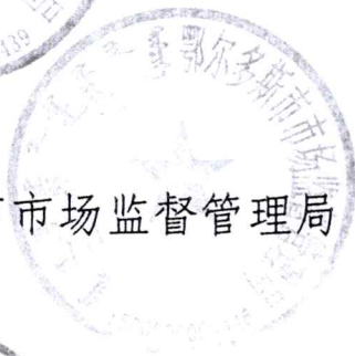
鄂尔多斯市市场监督管理局