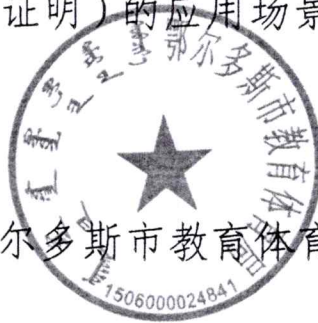
鄂尔多斯市教育体育局