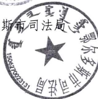
鄂尔多斯市司法局