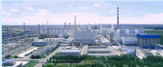
内蒙古久泰馨远新材料有限公司在鄂尔多斯市建设世界首套万吨级工业试验装置。

鄂尔多斯市入选2022年公众关注的内蒙古十大科技进展有3项,分别为:世界首套万吨级二氧化碳制芳烃工业试验项目落地;煤基特种燃料为火电机组降碳增效打通技术路径;原创抗癌“孤儿药”在我区进行中试量产。