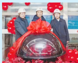
国能准能集团有限责任公司从提升煤炭热值入手创新,利用自产煤研发出纳米碳氢煤基特种燃料,并用于火力发电。