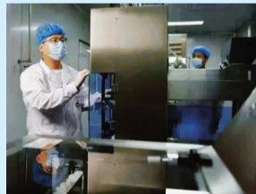
2022年,我国抗癌药质原创新药ACT001在鄂尔多斯尚德艾康药业抗癌药物研发与中试基地实现了临床用药的批量生产。